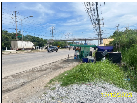
ทิศเหนือ