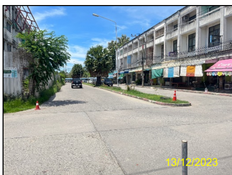
ทิศตะวันออก