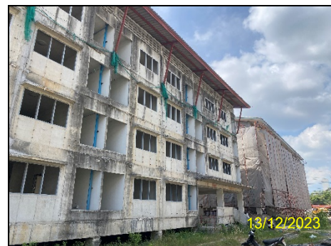
ภาพที่ 1-2 สภาพปัจจุบันของโครงการ