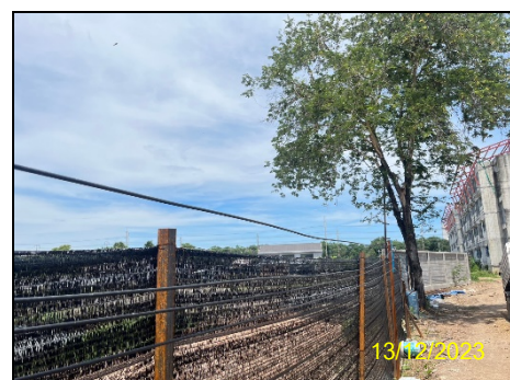
ทิศตะวันตก